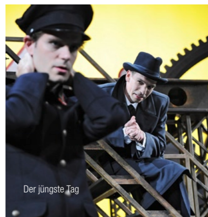
Der jüngste Tag

P 29. September 2012 Stadttheater Wilhelmshaven