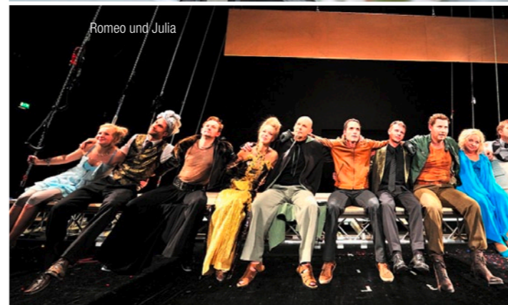
Romeo und Julia

Zeitgenössische Dramatik, die Entdeckung neuer Autoren aus Europa und die zeitgemäße Umsetzung großer klassischer Stoffe sind die Schwerpunkte des LTT-Spielplans, der sich 2012/13 mit Veränderungen und Umwälzungen im Bereich der Politik, der Arbeit und im Privaten auseinandersetzt.