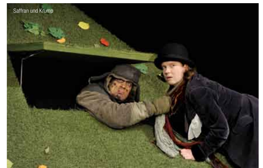
Saffran und Krump