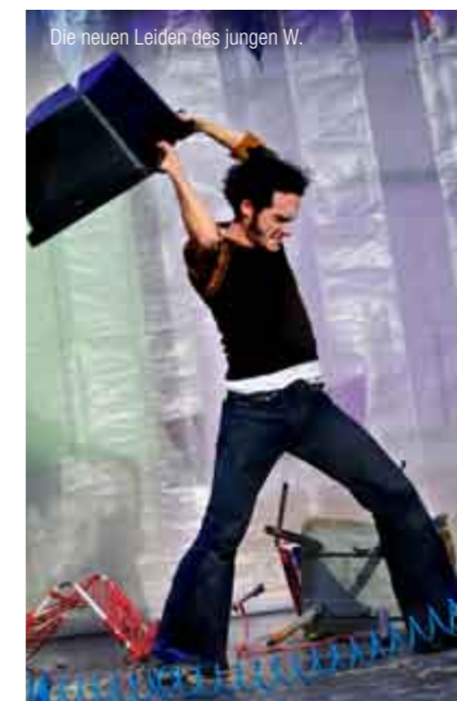
Die neuen Leiden des jungen W.