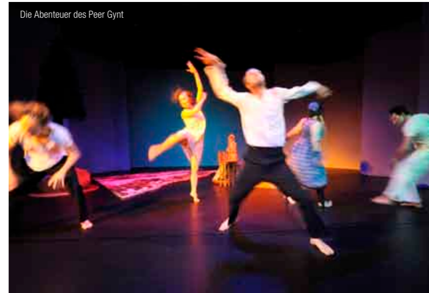
Die Abenteuer des Peer Gynt