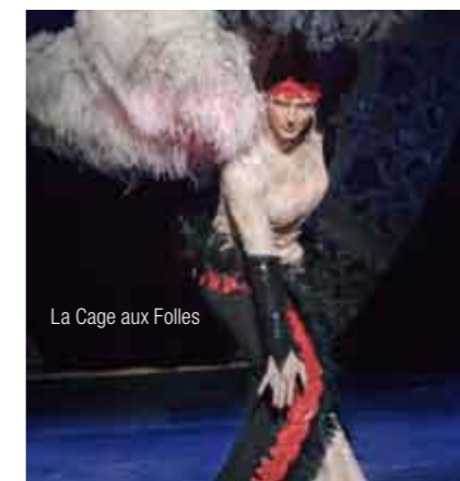
La Cage aux Folles

zu einer Endstation, sondern auch zu einem Startpunkt, einer Brücke und einem Ausblick auf ein Mehr.