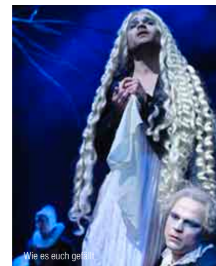
Wie es euch gefällt