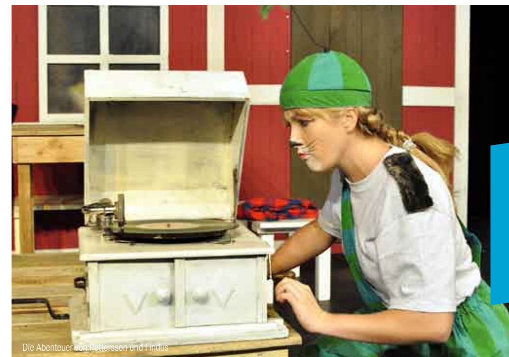
Die Abenteuer von Pettersson und Findus

Theodor Fontane, der als bedeutendster deutscher Vertreter des poetischen Realismus gilt, warf mit seinem im Jahr 1896 in Buchform erschienenen und später mehrfach verfilmten Werk EFFI BRIEST einen scharfen Blick auf die altpreußische Gesellschaft. Auf dieser Vorlage basierend, entwickelt die Bühnenfassung die Welt der Romanfigur mit nur zwei Schauspielern und mutet dabei äußerst aktuell an, sind doch Themen wie die Abhängigkeit jedes Einzelnen von gesellschaftlicher Anerkennung sowie die Möglichkeit der Verwirklichung von Sehnsüchten auch Fragen der heutigen Zeit.