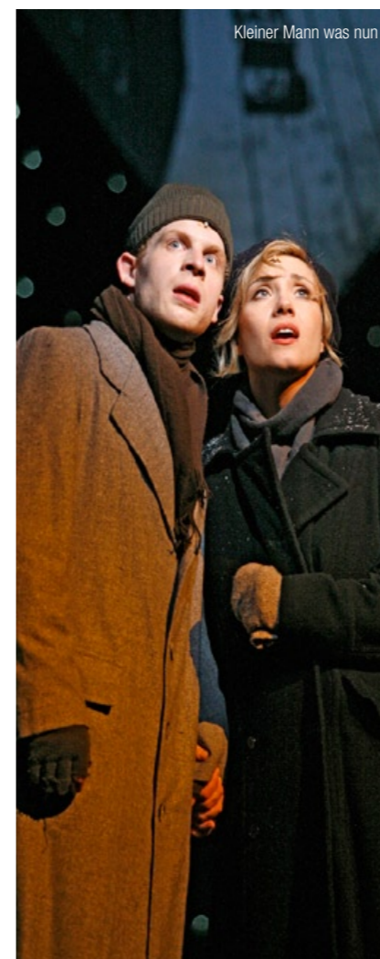
Kleiner Mann was nun

Valmont, Cécile zu verführen. Aber der Jäger Valmont ist auf der Pirsch nach einem anderen Wild. Die schöne, verheiratete und tugendhafte Madame de Tourvel ist das Objekt seiner Begierde. So beginnt ein doppelbödiges Spiel auf dem Schlachtfeld der Leidenschaft: Erringt Valmont Einlass bei beiden Frauen, gewinnt er eine Nacht mit der Marquise. Doch dann geschieht Unvorhergesehenes: Valmont liebt. Zum ersten Mal in seinem Leben sind die Gefühle für eine Frau nicht geheuchelt. Die Marquise hat gewonnen und doch verloren: Valmont war die Liebe ihres Lebens - aber sein Herz hat sie nie besessen. »Unter den erotischen und gesellschaftskritischen Romanen des 18. Jahrhunderts vielleicht der klügste, kühnste, unsentimentalste. Literarisch und psychologisch glänzend.« (Hermann Hesse).