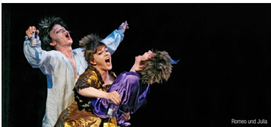
Romeo und Julia

sticht Tony auch Bernardo nieder. Er muss nun untertauchen. Durch eine Verkettung unglücklicher Umstände erfährt Tony fälschlicherweise, Maria sei gestorben. Tony läuft auf die Straße und fordert Chino (den Mann, mit dem Maria als Kind verlobt wurde) dazu auf, ihn zu erschießen, da sein Leben nun keinen Sinn mehr hätte. In diesem Moment sieht er Maria, die auf dem Weg zu ihrem verabredeten Treffpunkt ist. Die Liebenden stürzen aufeinander zu, doch Chino schießt auf Tony, der in Marias Armen getroffen niedersinkt. Über Tonys Leiche schließen die beiden Banden Frieden. Anders als in Shakespeares Tragödie nimmt sich Maria nicht das Leben.