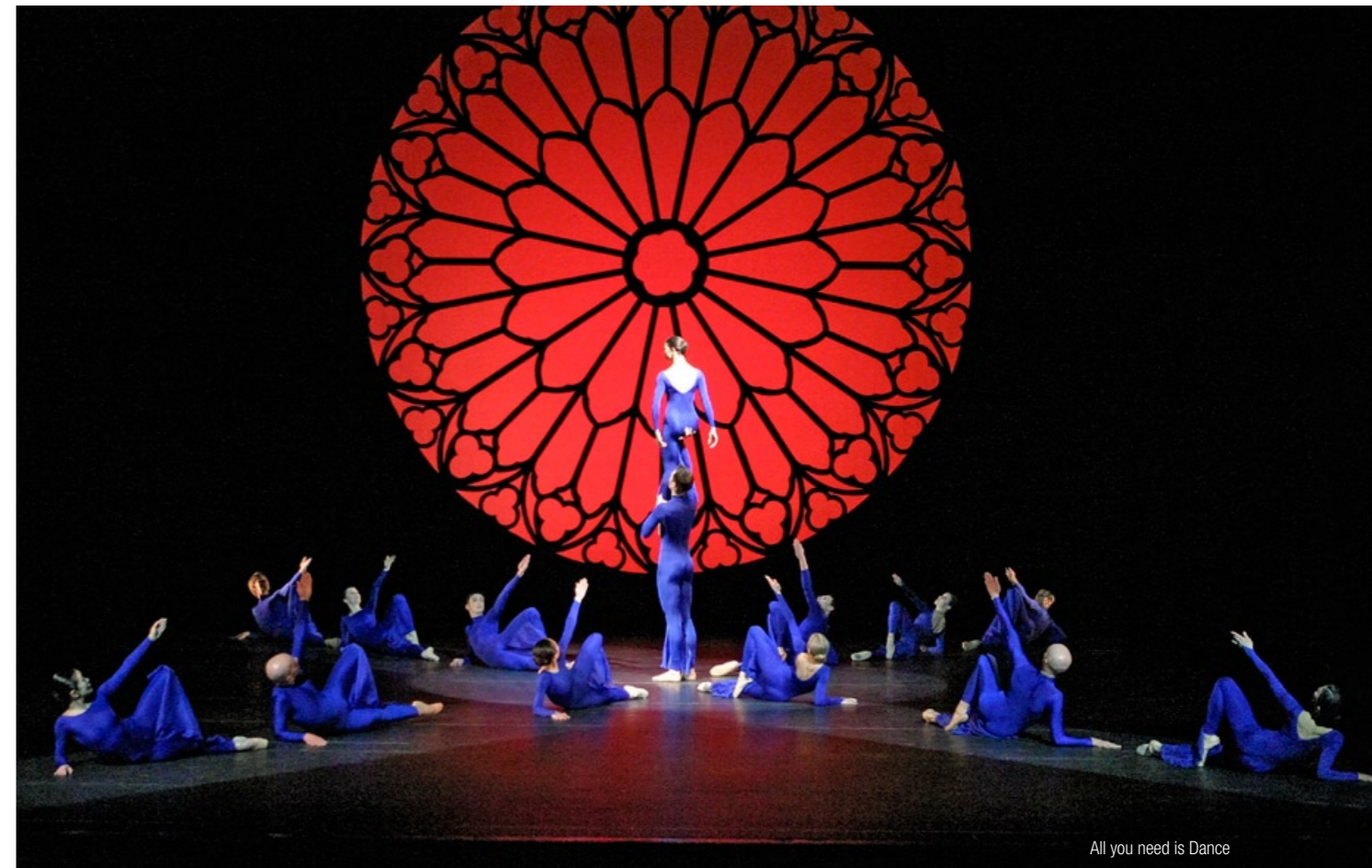
All you need is Dance

Ihr Geliebter hat sie verlassen, um von nun an ein anständiges Leben mit Ehefrau zu führen. Aussersehen hierfür: die junge, reiche und jungfräuliche Cécile. Um sich an ihrem Ex-Geliebten zu rächen, überredet die Marquise ihren verflissenen Liebhaber Vicomte de