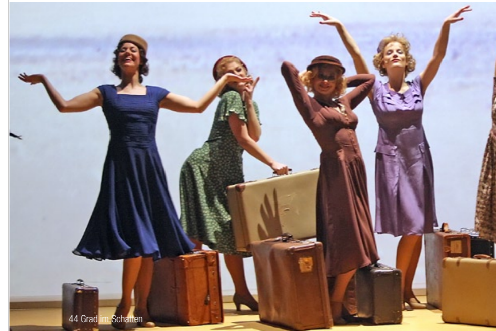
44 Grad im Schatten

Musical von Harvey Schmidt, Tom Jones und N. Richard Nash Es ist heiß in Three Point, Texas. Heiß und trocken. Während alle sich nach dem dringend