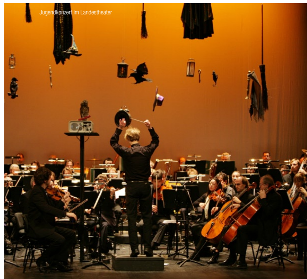
Jugendkonzert im Landestheater

Der seit vier Jahren existierende TheaterJugendClub des Landestheaters Detmold hat in den letzten Jahren interessante Projekte auf die Bühne gebracht. Nun, ausgestattet mit einer eigenen Kinder- und Jugendbühne, nimmt der Spielnachwuchs am Landestheater Detmold weitere Produktionen in Angriff.