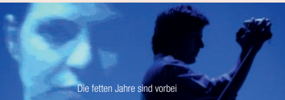
Die fetten Jahre sind vorbei