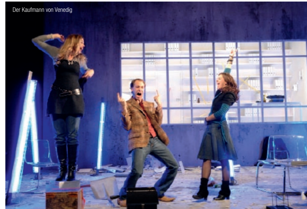
Der Kaufmann von Venedig