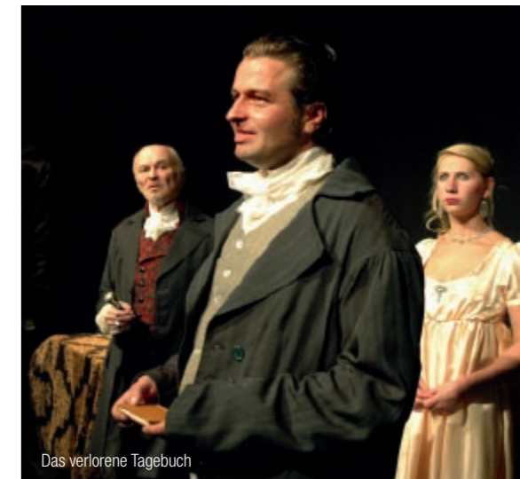
Das verlorene Tagebuch

Hugo von Hofmannsthal schuf einen Helden, der ganz gewöhnlich ist, der Mensch