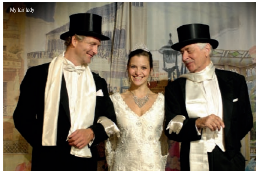
My fair lady

Niemand kennt Sir so gut wie Norman, nicht einmal seine Ehefrau Milady ist so vertraut mit den Gewohnheiten, mit den Vorlieben und Schwächen des großen Schauspielers. Und nur mit seiner Hilfe kann Sir die Vorstellung spielen, buchstäblich mit letzter Kraft. Tragisch und berührend, aber auch immer wieder komisch ist dieser Blick hinter die Kulissen während einer Shakespeare-Vorstellung. Bekannt wurde »Der Garderobier« aber vor allem durch seine Oscar-gekürzte Verfilmung 1983 (dt. Titel: »Ein ungleiches Paar«).