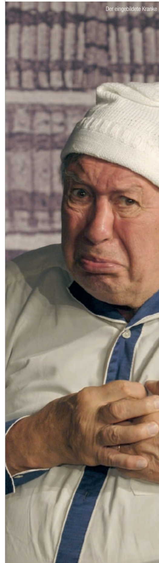
Der eingebildete Kranke