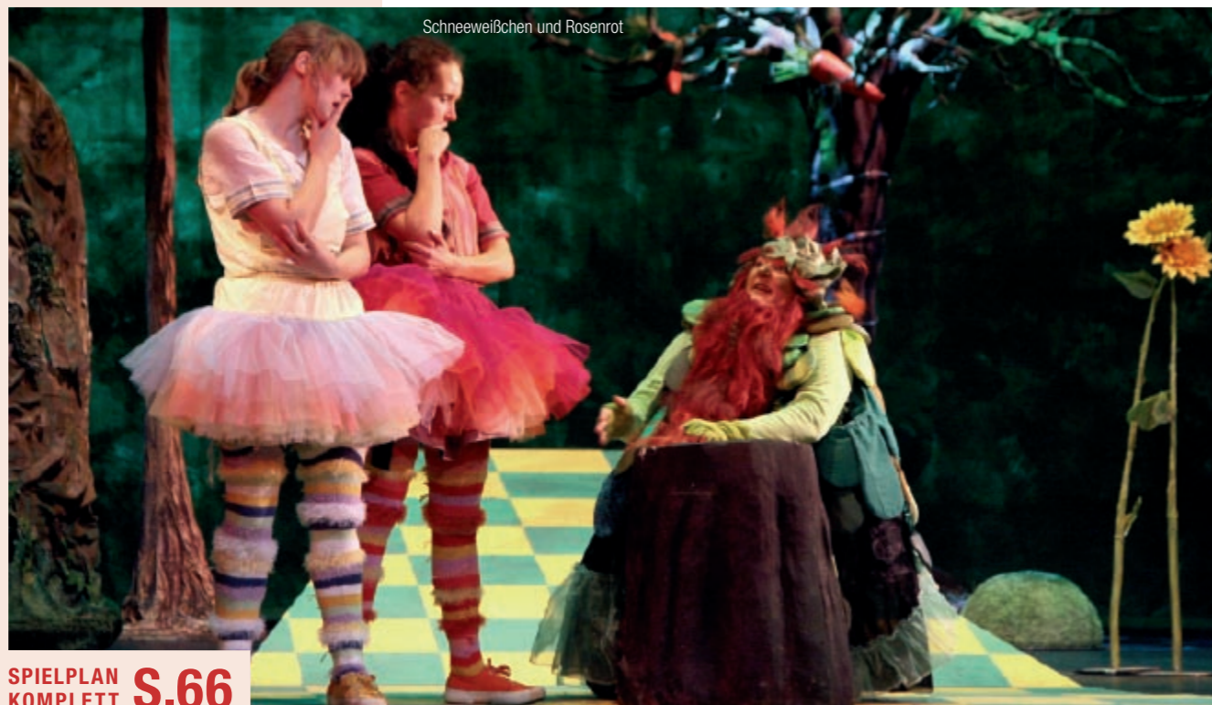
Schneeweißchen und Rosenrot

EIN KÄFIG VOLLER NARREN Jerry Herman / Harvey Fierstein, Musical »Ein Käfig voller Narren« war das erste Musical, das sich um schwule Themen drehte. Es gewann sechs Tony Awards und wurde 1761-mal am Broadway gespielt.