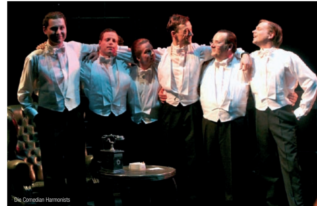
Die Comedian Harmonists

Samuel Beckett, Schauspiel Dieses zentrale und vieldeutige Bühnenwerk der 2. Hälfte des 20. Jahrhunderts hat eine unübersehbare Fülle von Interpretationen provoziert. Vor allem die vom Autor nie definierte Figur Godot entzündete die Phantasien der Interpreten. Auf die des Theaters der Altmark dürfen Sie gespannt sein!