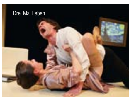
Drei Mal Leben