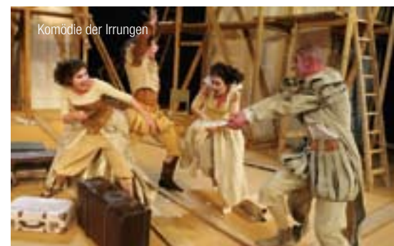
Komödie der Irrungen