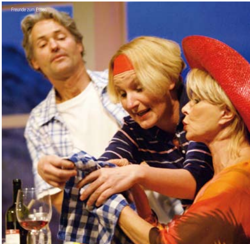
Freunde zum Essen

Kann es eine Freundschaft zwischen Menschen und Vampiren geben? Ja, denn Anton, das Menschenkind, das Gruselgeschichten liebt und das Vampirkind Rüdiger sind schnell die besten Freunde. Wenn bloß die Eltern nicht so neugierig wären, denn die dürfen nicht erfahren, dass Rüdiger ein waschechter Vampir ist. Zusammen erleben die beiden eine Reihe von spannenden Abenteuern. Die Kinderbücher wurden über 10 Millionen Mal verkauft und in über 30 Sprachen übersetzt.